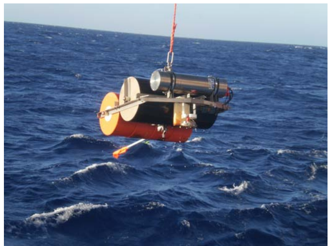
Abbildung 2 (oben): Bergung eines OBS