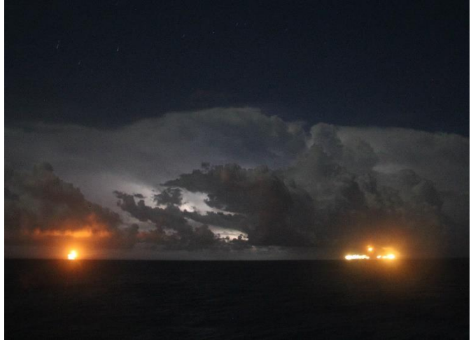
Abb. 2 Wetterleuchten.

Komplettiert wurden die Arbeiten auf dem Schelf und Schelfhang durch ein umfangreiches Wasserbeprobungsprogramm, sowie durch Planktonfänge mittels Multischließnetz. Um 19 Uhr wurden die Stationsarbeiten im Schelfhangbereich abgeschlossen und mit dem etwa 24-stündigen Transit in das nächste Arbeitsgebiet, dem Schelf nahe der Mündung des Rio Jequitinhonha, begonnen. Dort werden wir bis Montag (04.03.16) Stationsarbeiten nahe der Flussmündung durchführen.