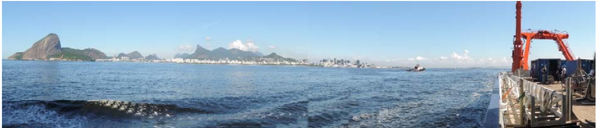
Abb. 1 Die METEOR beim Auslaufen vor Rio de Janeiro.

Am Montag, dem 21.03.2016, pünktlich um 09:00, stach die METEOR vor der grandiosen Kulisse Rios in See. Da das erste Arbeitsgebiet nur einen halben Tag Transit entfernt lag, blieb leider wenig Zeit für einen letzten Blick auf den Zuckerhut, es mussten statt dessen Labore belegt und unsere Geräte aufgebaut werden.