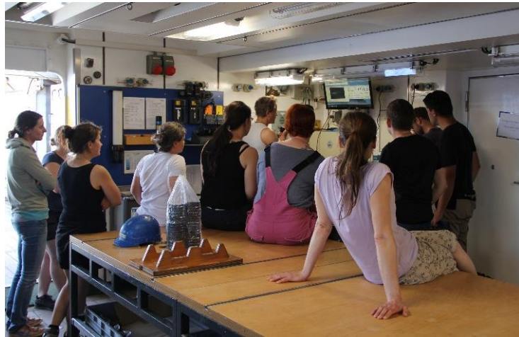
Abb. 1 Der Einsatz des Kolbenlotes erzeugt immer viel Aufmerksamkeit – hier eine Menschenansammlung im Geologielabor vor dem Monitor, der den „Einschlag“ des Kolbenlotes am Meeresboden anzeigt.

Das Hauptaugenmerk während der dritten Woche der M125 lag aber in der Gewinnung von Sediment-, Wasser- und Planktonproben im Bereich des Schelfs und Schelfhanges des nahegelegenen Rio de Contas. Wie der Jequitinhonha entwässert der 620 km lange Rio de Contas das anliegende hügelige Hinterland. Dies bedeutet, dass wir durch unsere Klimarekonstruktionen, die wir an den Sedimenten der beiden Flüsse durchführen wollen, ein regional genau begrenztes Signal erhalten werden. Da der Schelf vor dem Rio de Contas mit stellenweise nur 8 km Breite au-