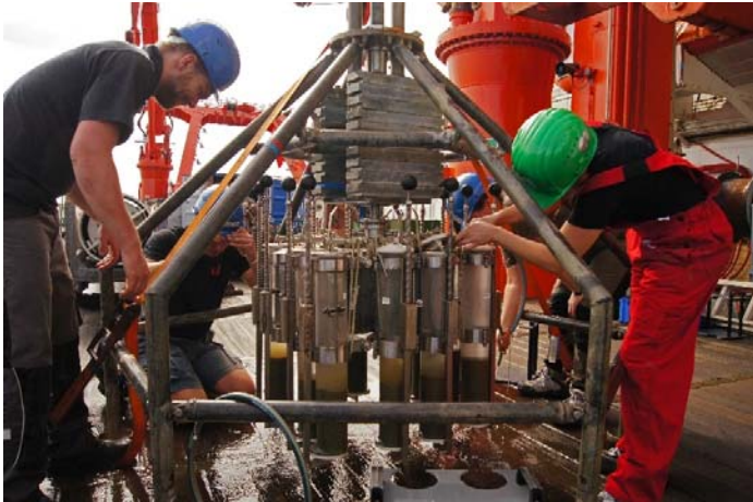
Abb. 3 Bergung der Multicorer-Rohre.

Stationsarbeiten haben planmäßig am Abend des 21.3.16 in unserem ersten Arbeitsgebiet auf dem Schelf östlich von Cabo Frio mit einem Multibeam/Parasound (MBPS)-Survey begonnen. 13 Wasserproben mittels CTD/Rosette sowie 10 Proben von Oberflächensedimente (mittels Multicorer) stellen eine gute Abdeckung des Arbeitsgebietes sicher. Trotz des erfolgreichen Einsatzes des Multicorers erwies sich der Einsatz des Schwerelotes auf Grund des unter-