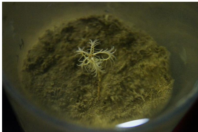
Abb. 3 Eine Seelilie, die wir aus 450 m Wassertiefe mit einem Multicorer an Deck gebracht haben.